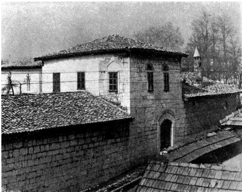
Hadži Sinanova Tekija. Pogled sa jugoistoka.

Usred dvorišta tekije sahranjena su trojica pročelnika (šejhova) ove tekije, 6 a osim ovih tu je i grob Mir-Hakije, sina Ali-Galib-paše Rizvanbegovića-Stočevića. 7 Nad nišanima dvojice spomenutih šejhova postojalo je sve do pred II svjetski rat obično malo turbe, zidano od drveta i ćerpiča.