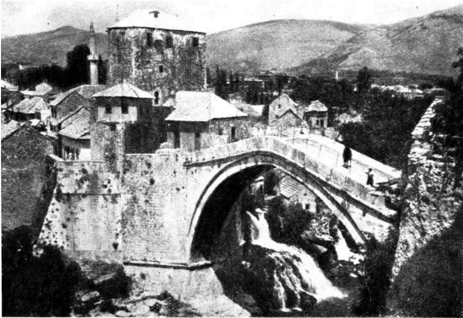
MOST SA DESNOM KULOM I STRA- ŽARNICOM. U trodimenzionalnoj kom- poziciji raznih kockastih, cilindričnih i paraboličnih tijela, mali objekti daju većima mjerilo i čine ih vizuelno još snažnijim.

tim, počev od opravke pojedinih objekata, treba voditi računa da se sve snage i krediti planski i efikasno koriste, da čine pojedinu etapu do konačne faze, pa makar to trajalo i deset godina.