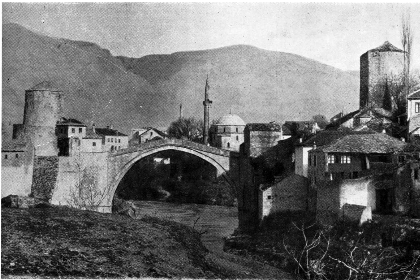
STARI MOST SA KULAMA — POGLED S JUGA. Snimak iz vremena prije gradnje mekteba na lijevoj obali. Kamena aglomeracija, uglavnom, još nenarušena nekontroliranom izgradnjom u kapitalističkoj epohi.

mediteransko sunce, što stvara divne kontraste svjetla i sjene — to je stari Mostar. Razvijajući se od postanka koliko u duhu domaćeg shvatanja i stvaranja, toliko i pod utjecajem dalmatinsko-mediteranskog i orijentalno-turskog naziranja, on