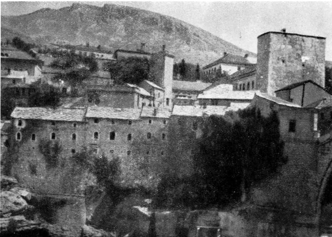
MAGAZE NA LIJEVOJ OBALI.— Aglomeracija raste stepenasto od najmanjih objekata do najviših

Prvi put spominje ovaj most turski geograf sedamnaestog stoljeća Hadži Kalfa, koji piše: »U Mostaru ima jedan svod, sazidan 974 god.« (odgovara 1566 po našoj eri). Putopisac Evlija Čelebija u svojoj »Sejahatnami« kaže između ostalog: »Mostar znači kopri-liš-šehar (grad s mostom).