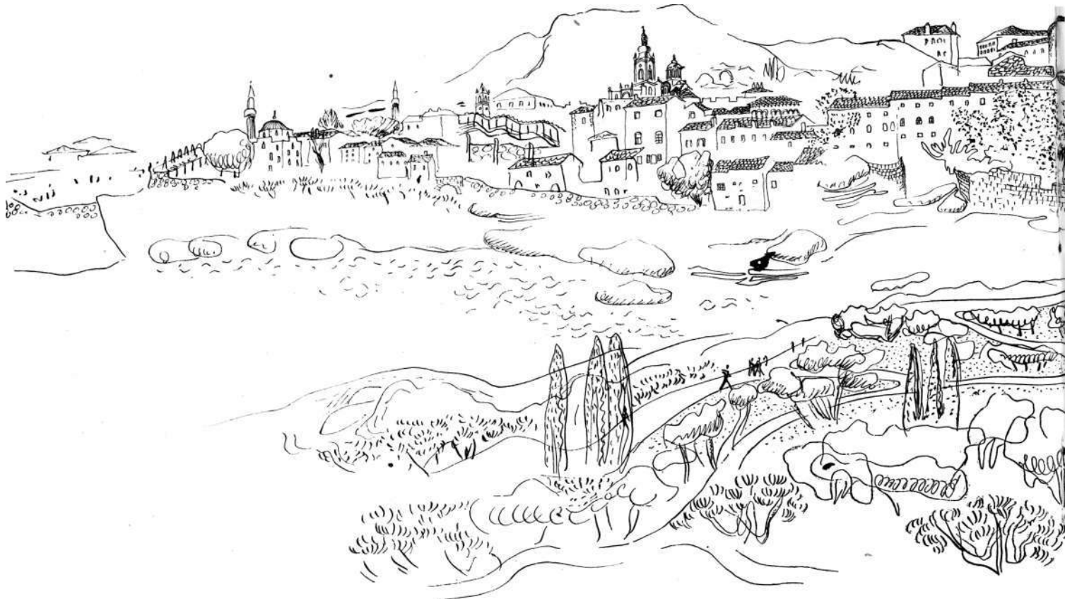
AKSONOMETRIJA PREDJELA OKO STAROG MOSTA. — Unesene su predložene korekture. Čitav kompleks od Glavne

Nema sumnje da je kod rješavanja ovog problema potrebno dati i prioritet spomeniku, dok će u