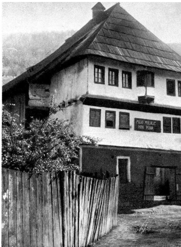
Musafirhana u Jajcu

Foča: U Foči su u toku 1953 godine vršeni adaptacioni radovi na Kukavičinom hanu. Ovaj ugostiteljski objekt iz XVIII stoljeća bio je potpuno dotrajao, tako da su projek-