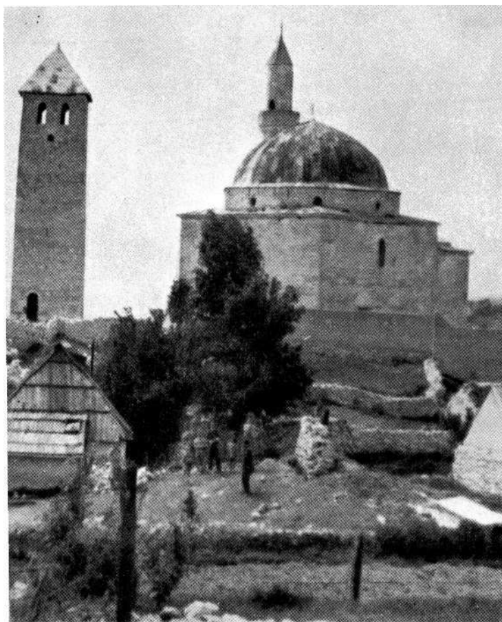
Glavica džamija u Livnu