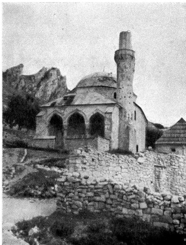
Balaguša džamija u Livnu

poslije savjetovanja konzervatora FNRJ u Splitu, održana je u Mostaru konferencija sa predstavnicima lokalnih vlasti i građana, a kojoj su, pored predstavnika našeg Zavoda, prisustvovali kao gosti i arh. Ivan Zdravković, nauč. suradnik Saveznog instituta za zaštitu spomenika kulture u Beogradu, te arh. Mladen Fučić, konzervator Konzervatorskog zavoda u Zagrebu. Na ovoj konferenciji prodiskutovani su aktuelni problemi zaštite spomenika kulture u mjestu, te u izvjesnim problemima pravilnije usmjeren odnos savremenog građenja prema arhitektonskom nasljeđu uopšte. Puno razumijevanje građana za spomenike pomoglo je da u zaključke konferencije uđu formulacije koje zahtijevaju respekt nasljeđenih urbanističkih kvaliteta pri projektiranju novih objekata.