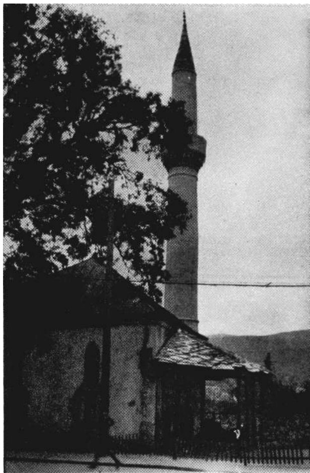
Roznamedžijina džamija u Mostaru

Pored radova na objektima u Mostaru su u toku 1953 godine učinjeni i izvjesni naponi u smislu prenošenja brige oko spomenika i na same građane. U aprilu 1953 godine,