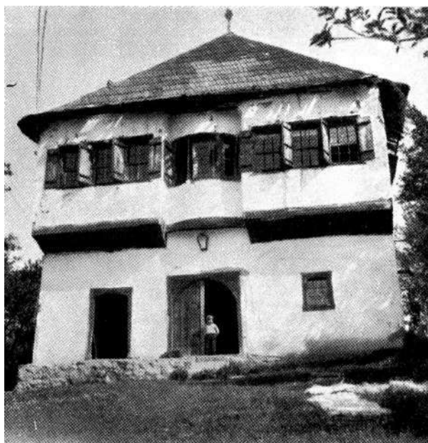
Čardak Memiševića u Crnotini kod Sarajeva