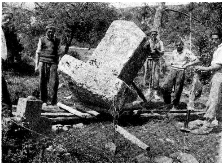
Prenos stećaka iz Doline Neretve u Konjic