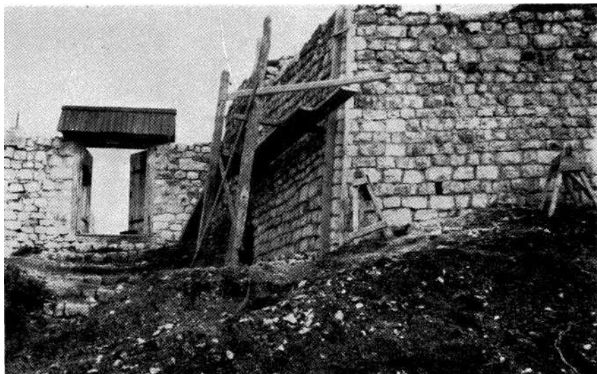
Stari grad u Doboj u — restaurirani dio zida kod vanjske kapije

Od novih i važnijih poslova koji se predviđaju u sljedećoj godini potrebno je, prije svega, istaknuti restauraciju srednjevjekovnog grada Ostrošca, kod Bihaća, za koju su pripreme već počele.