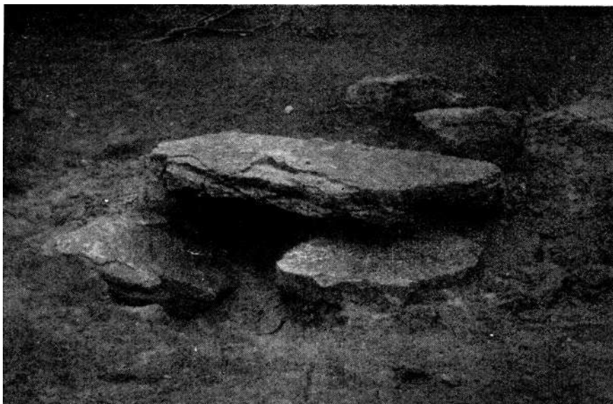
Rimski bunar u Bunarima.

se i danas sahranjuje. (Poznato je pod imenom Kužje groblje). — Ova dva groblja spominje i Blau.