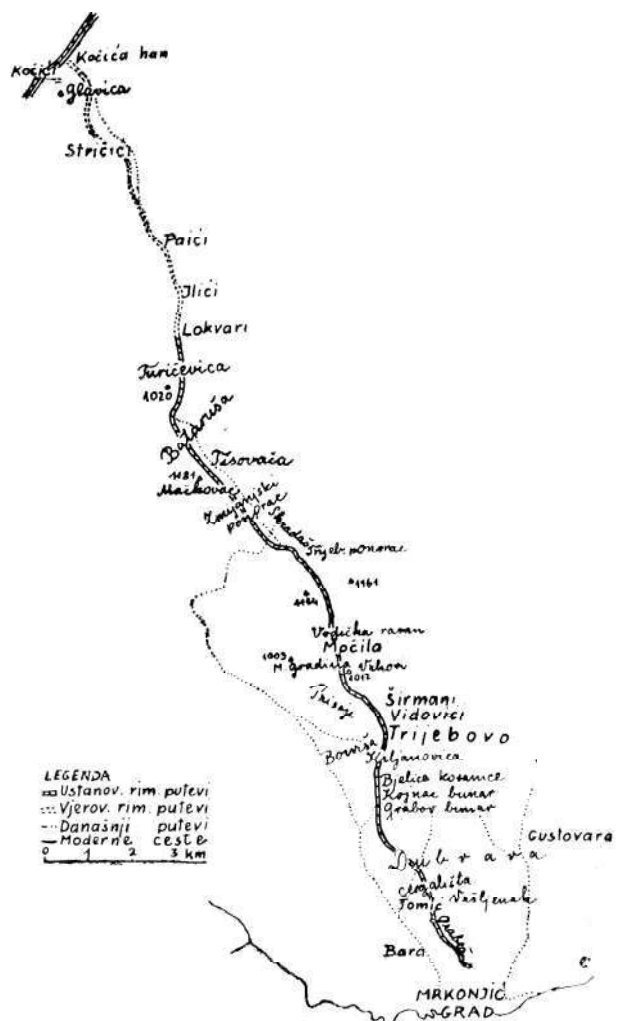
Skica puteva od Mrkonjićgrada prema Banjaluci.

Put dalje produžuje na prostranu visoravan Dubravu obraslu u sitno rastinje. Na ovom dijelu vide se mjestimično ostaci kaldrme koja je zarasla u grmlje. Danas je to vrlo gust i bezvodan predio. Istina, na zapadnim okrajcima Dubrave ima zaseok Kučića, čiji je naziv karakterističan.